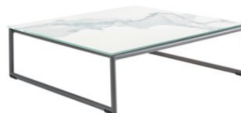
Table basse avec structure aluminium - Plateau en céramique