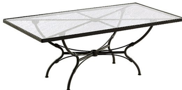
Table repas rectangulaire 200 x 100 cm avec structure en aluminium forgé et plateau verre martelé